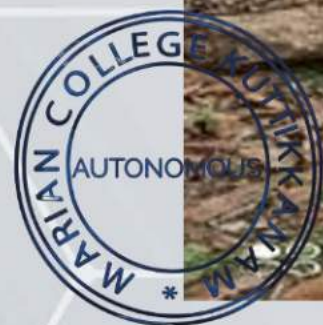
Distribution of Food Kits(09/05/2020)