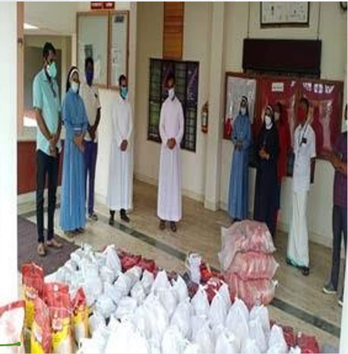
Distribution Of Food Kits And Learning Materials (04/06/2021)

ക്ഷേപകിറ്റുകളും പഠനോപകരണങ്ങളും വിതരണം ചെയ്തു കുട്ടിക്കാരുടെ മതിയായ ഭക്ഷണവും പഠനോപകരണങ്ങളും വിതരണം ചെയ്തു. വിദ്യാഭ്യാസ കോളജിലെ ജീവനക്കാരുടെയും അധ്യാപകരുടെയും സഹായത്തോടെ പഠനോപകരണങ്ങളും വിതരണം ചെയ്തു. വിദ്യാഭ്യാസ കോളജിലെ ജീവനക്കാരുടെയും അധ്യാപകരുടെയും സഹായത്തോടെ പഠനോപകരണങ്ങളും വിതരണം ചെയ്തു. പരിപാടികളുടെ ഉദ്ദേശ്യം മതിയായ ഭക്ഷണവും പഠനോപകരണങ്ങളും വിതരണം ചെയ്തു. വിദ്യാഭ്യാസ കോളജിലെ ജീവനക്കാരുടെയും അധ്യാപകരുടെയും സഹായത്തോടെ പഠനോപകരണങ്ങളും വിതരണം ചെയ്തു.