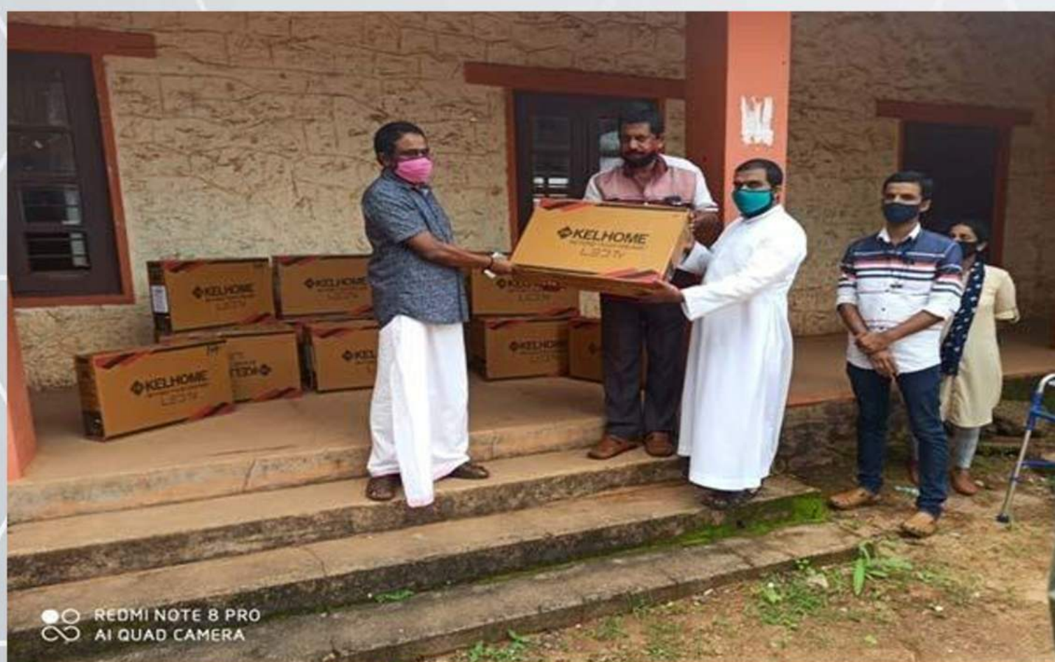
Distribution of Television (08/07/2020)