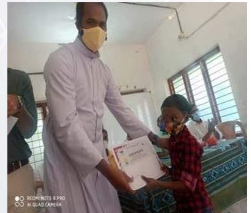
Prize Distribution (23/01/2021)