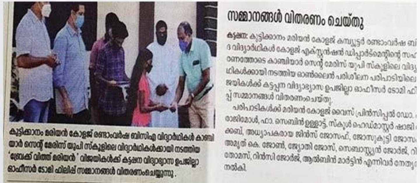
Training For Students at St Marys School Kanchiyar (23/01/2021)