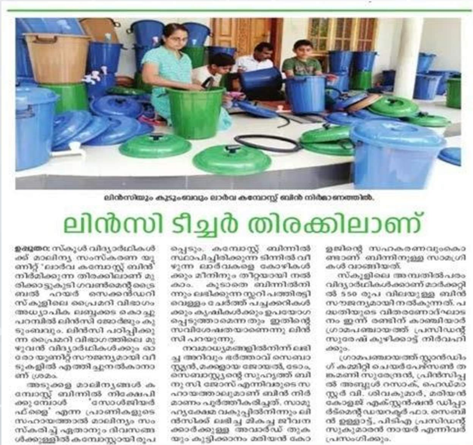
Waste Management Awareness(26/04/2021)