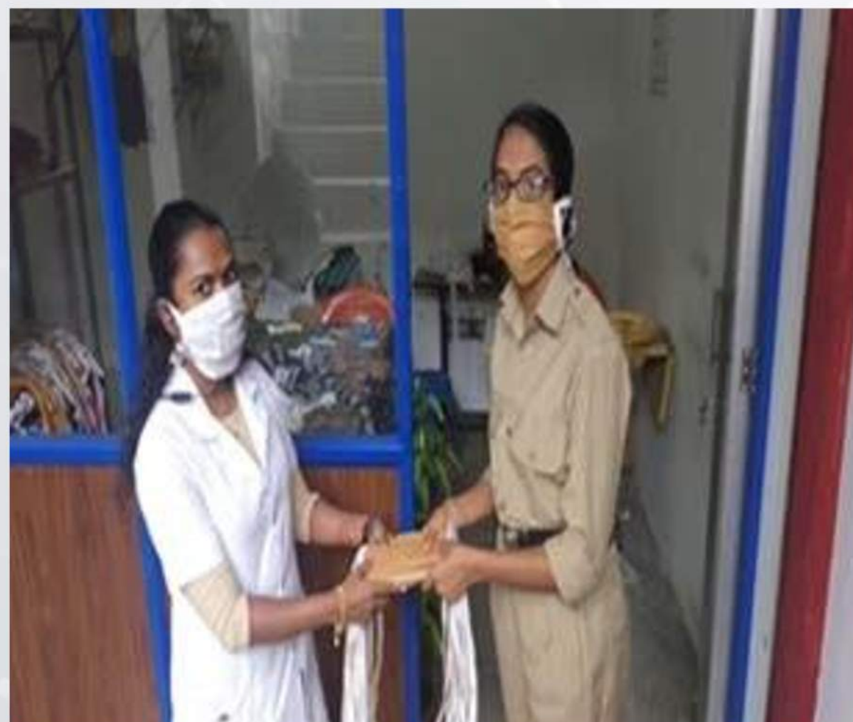
Mask Distribution (12/04/2021)