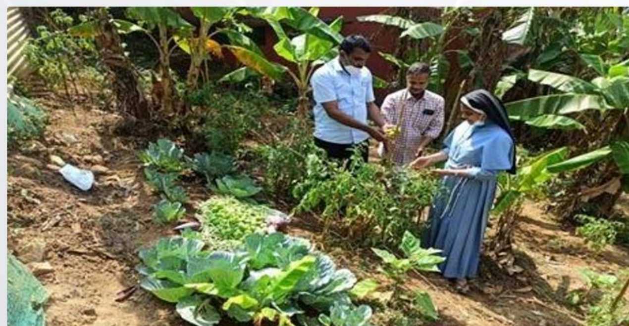
Harvesting of Vegetables(22/02/2020)