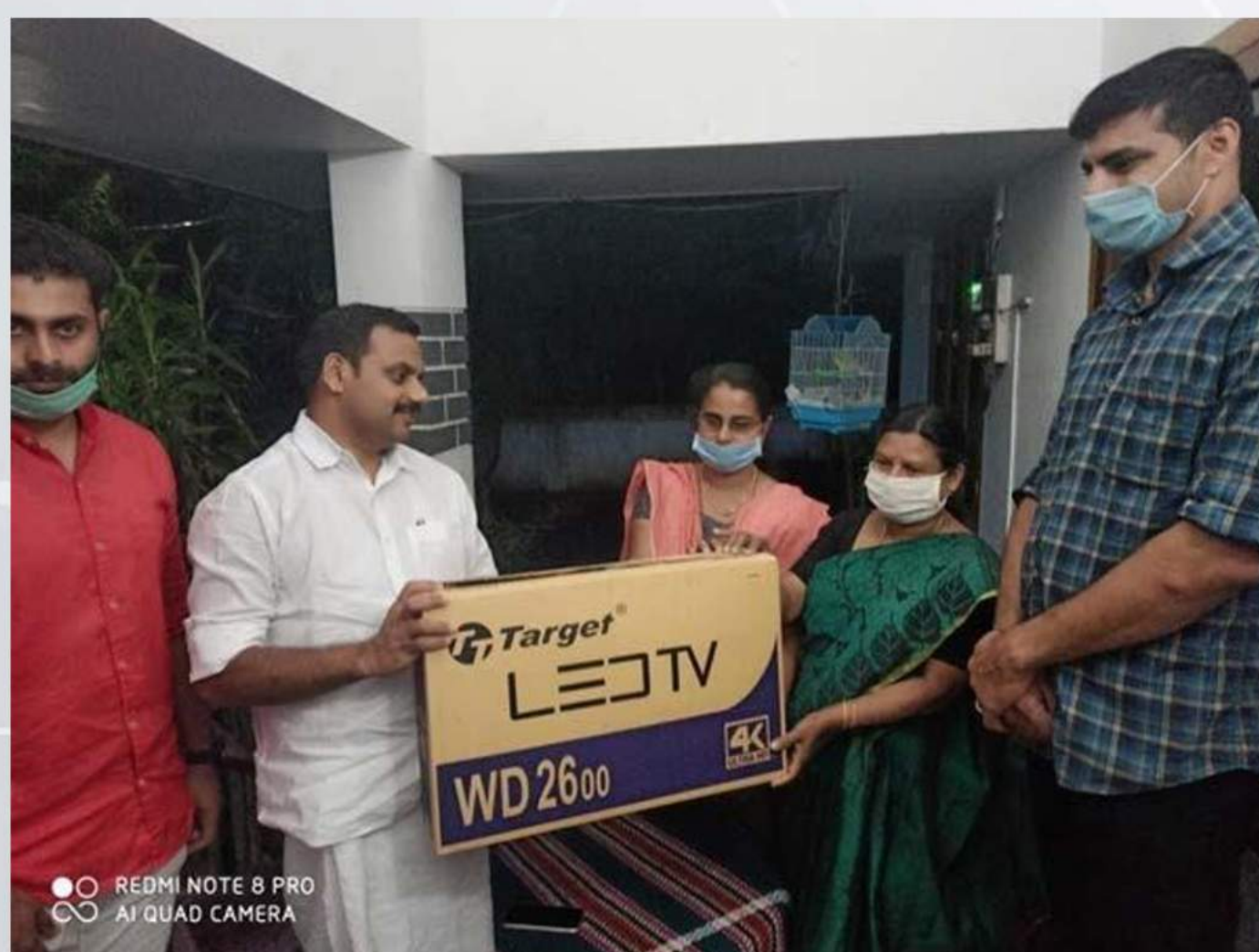
Distribution of Television- Murikkattukudy Govt. Tribal School(03/08/2020)