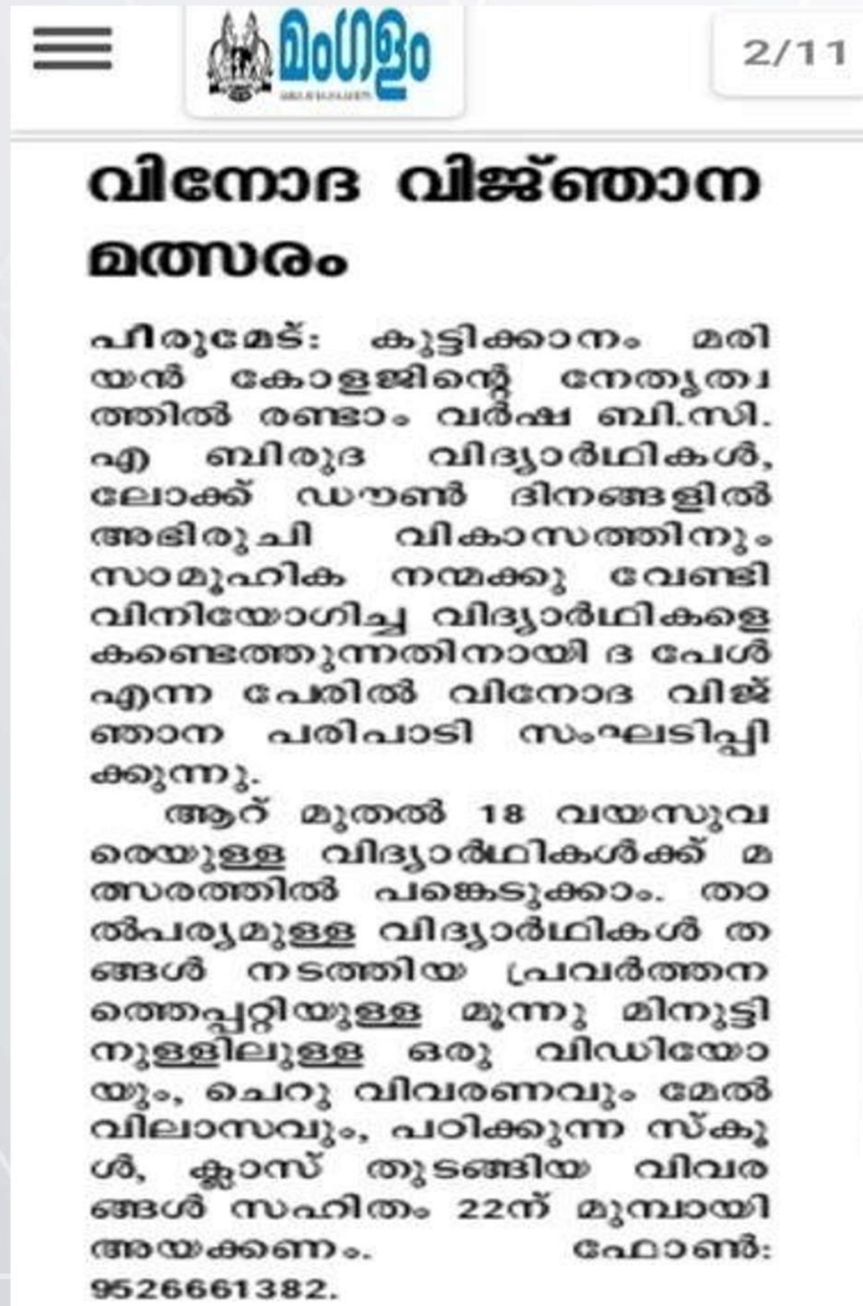
PEARL-Entertainment Knowledge Program (08/08/2020)

The Extension Department of Marian College associated with the BCA Department conducted a program named “The Pearl”. During the lock-down days on August 8 th 2020, programs were organized for the betterment of the children and for the betterment of the society. The program was conducted on-line for children between the ages of 6 -18 years.58 students participated in this event.