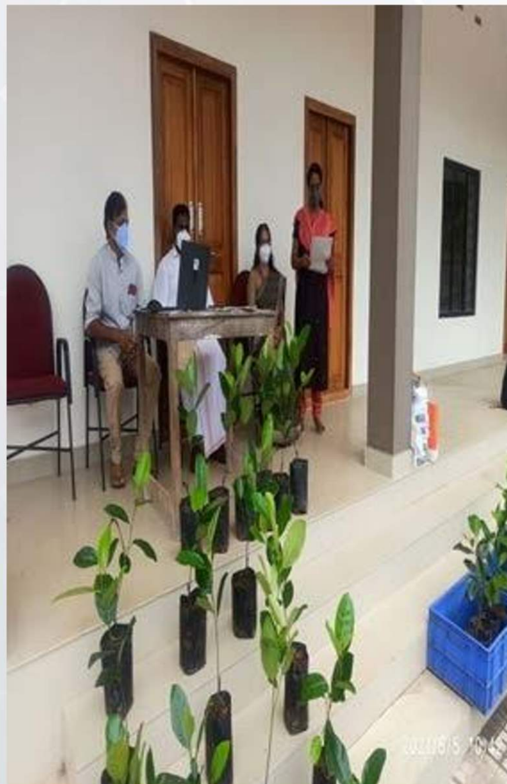
Environmental Day Celebration (05/06/2021)