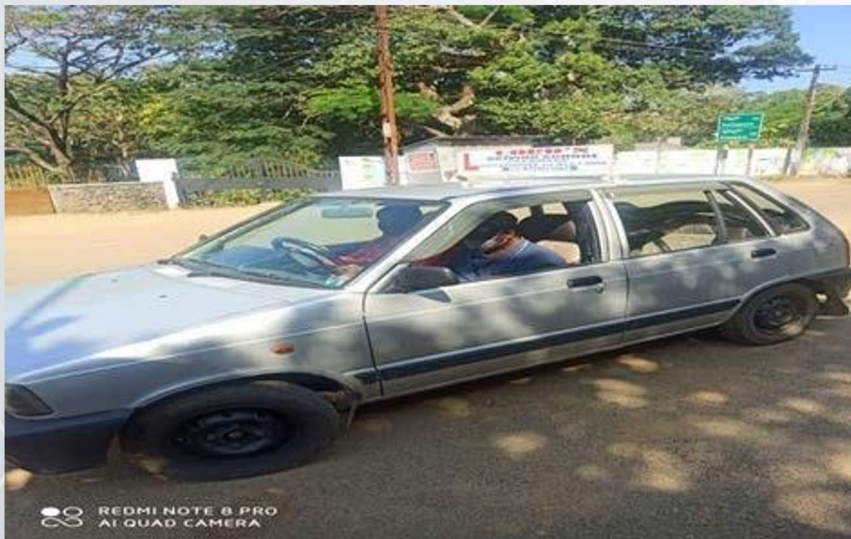
Marian Driving School

The Extension Department of Marian Driving School was initiated to provide training for two, three and four wheels. "Lord's" Driving School also provides learner's driving license for light Motor Vehicles like cars, motorcycles and autorickshaw. Many students get driving licenses from this institution every year. 10 students gained benefit of this activity.